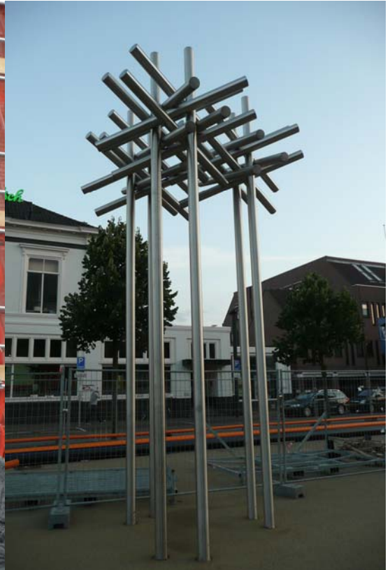
'Bomen II', 2004 roestvrijstaal, Rinus Roelofs