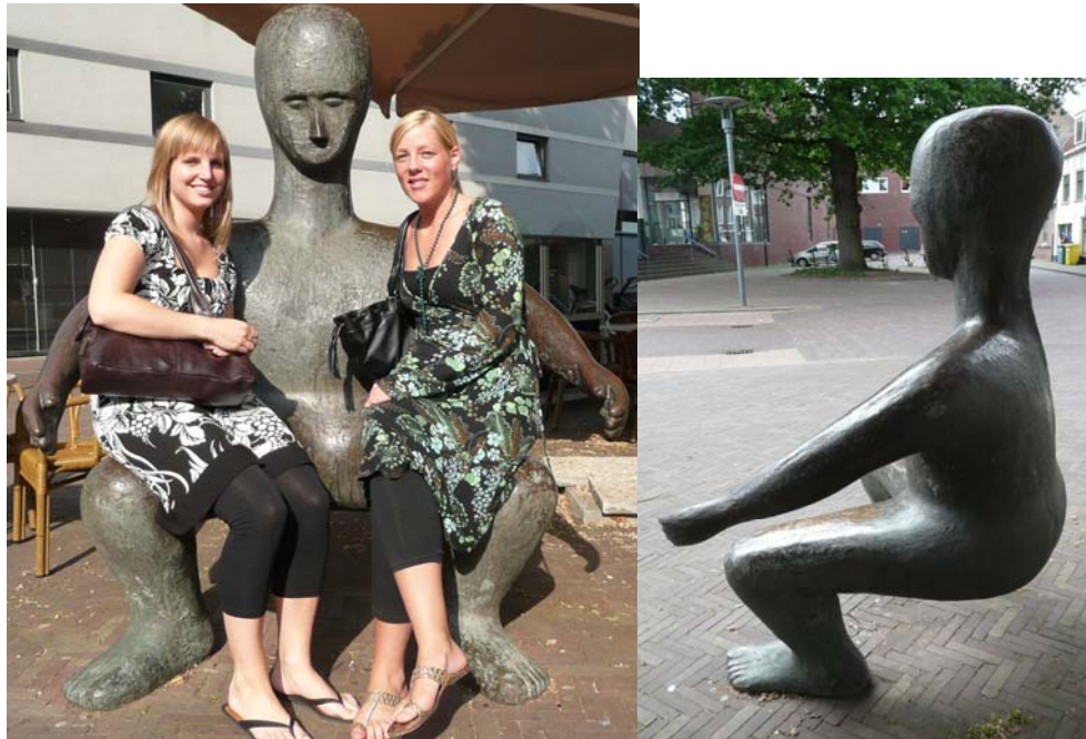
Op schoot in Amersfoort, 2003 brons, Henk Visch

Projecteer de afbeeldingen van de kunstwerken met behulp van digibord of zorg voor A4 of A3 kleurenkopieën.