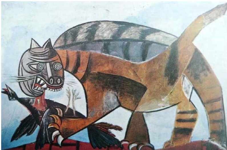
Kat die een vogel verslindt, 1939 olieverf op doek, Pablo Picasso

Projecteer de afbeeldingen van de kunstwerken met behulp van een digibord of zorg voor A4 of A3 kleurenkopieën.