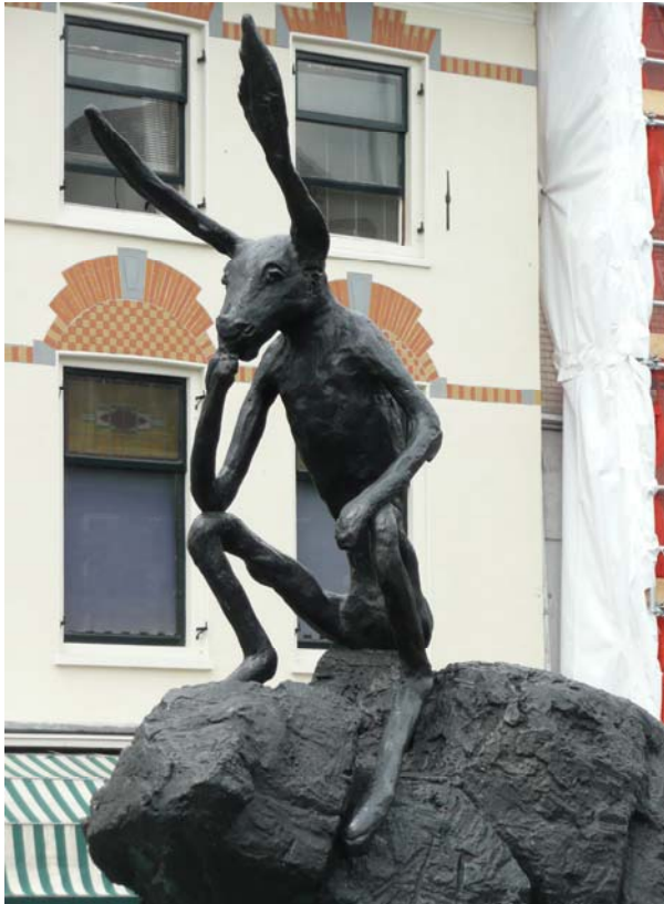
'Thinker on a rock', 1990 brons, Barry Flanagan

Projecteer de afbeeldingen van de kunstwerken met behulp van een beamer of zorg voor A3 of A4 kleurenkopieën.