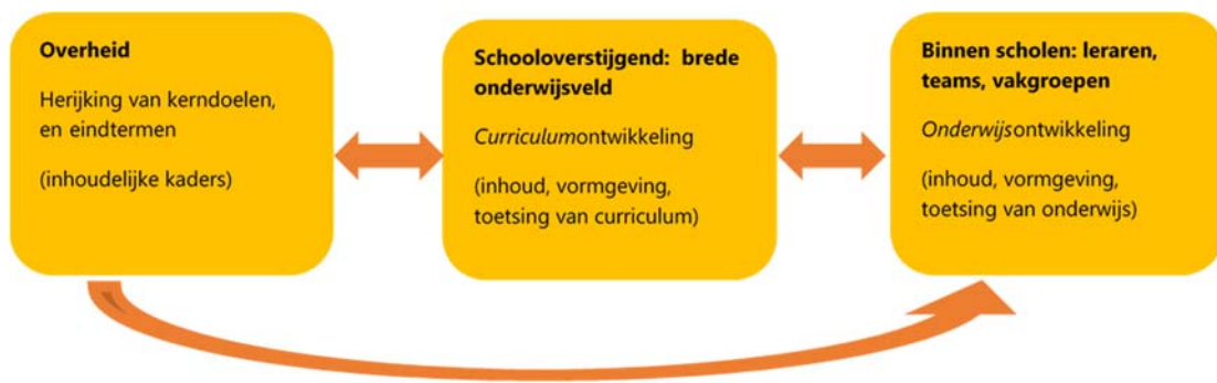
Figuur 1. Schematische weergave van processen binnen curriculumvernieuwing

Curriculumvernieuwing betreft volgens de raad drie verschillende processen, namelijk 1) het herijken van kerndoelen en eindtermen; 2) curriculumontwikkeling; en 3) onderwijsontwikkeling. Figuur 1 geeft deze verschillende processen (en het niveau van het onderwijssysteem waarop deze plaats moeten vinden) schematisch weer. De pijlen in de figuur geven de voeding aan die nodig is voor herijking en ontwikkeling. De figuur geeft noch fases weer (de processen lopen gelijktijdig en in wisselwerking met elkaar) noch hiërarchie (in de zin van mate van belangrijkheid). Hieronder worden de verschillende processen nader toegelicht.